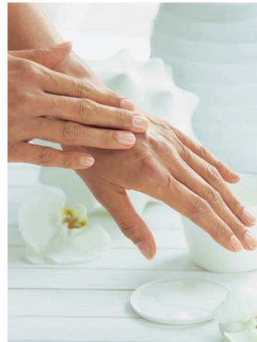
... auf die Haut auftragen und die wohltuenden Inhaltsstoffe wirken lassen.

Pflegestoffen – auf einen kleinen Teller. Einen Tropfen verreibt er zwischen den Händen. Amaryllisduft liegt in der Luft.