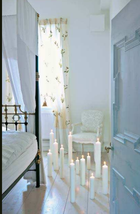
Von Schlafzimmer bis Bad: Seit dem Beginn der Landhausbewegung erobern Kerzen alle Wohnbereiche.