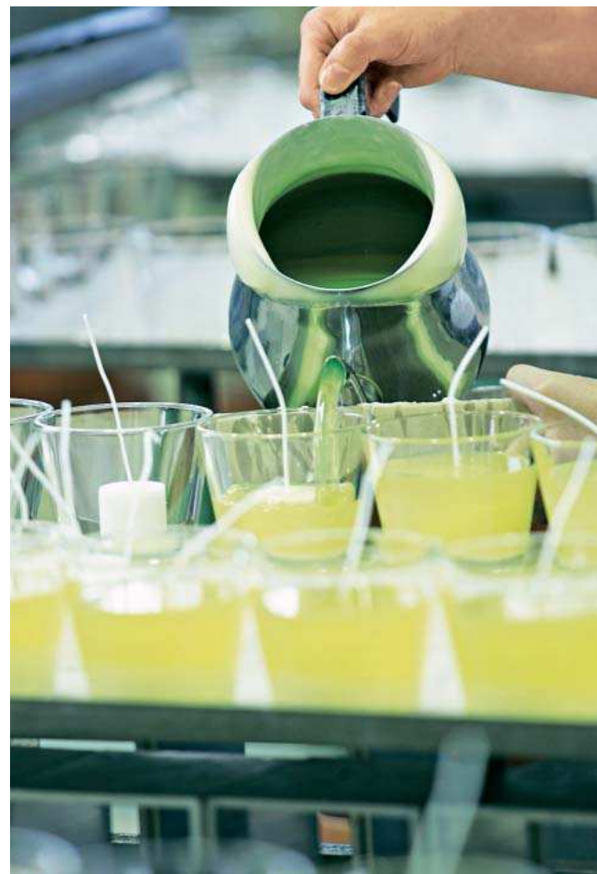
Mit Teekanne, Augenmaß und Feingefühl: Von Hand wird das flüssige Wachs in die Kristallvasen gefüllt.

◊ beim Gießen. Daher brennen sie schneller und unruhiger ab.“ Ein weiterer Vorteil der traditionellen Verfahren: Gegossene und gezogene Kerzen können „durchgefärbt“ sein, also gänzlich aus farbigem Wachs bestehen – anders als preisgünstigere Exemplare, die oft nur von einer bunten Schicht überzogen sind.