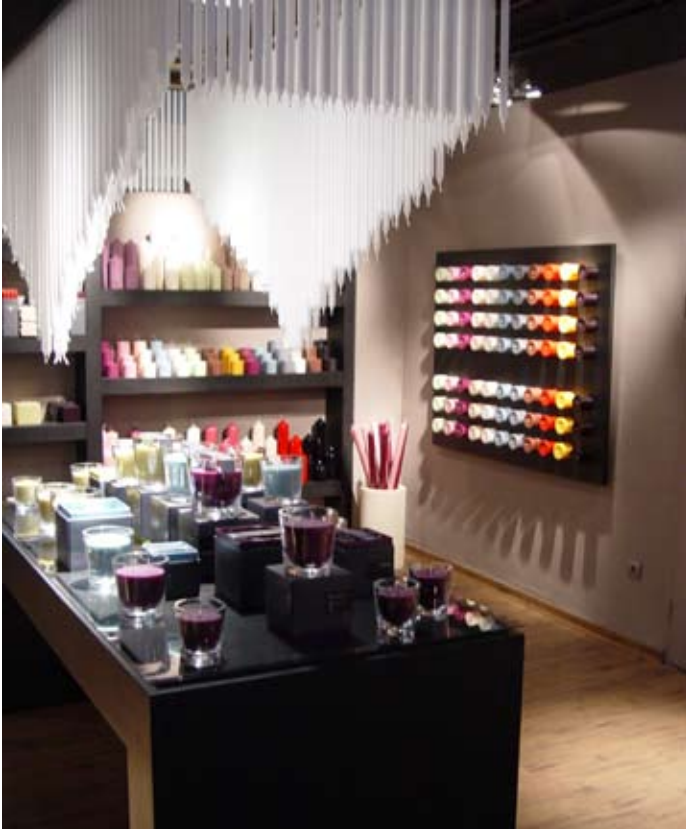
Das Zentrum bildet ein Kerzentisch mit Kronleuchter.