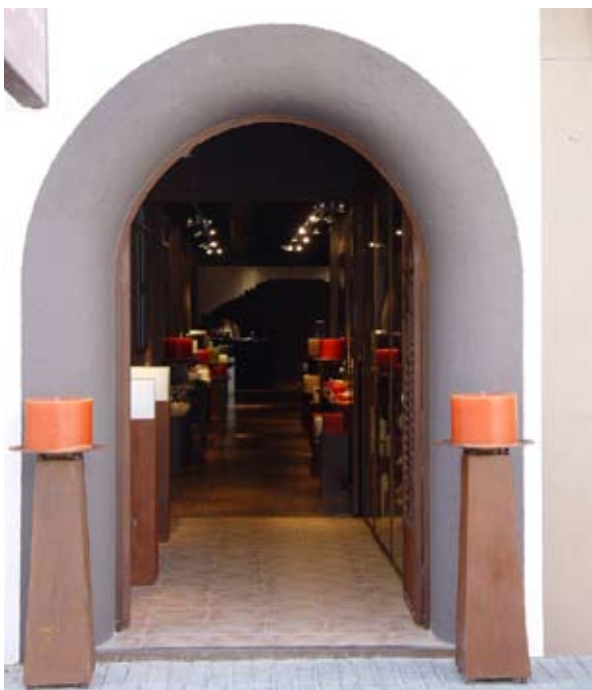
Finka-Kerzen stehen dem Kunden